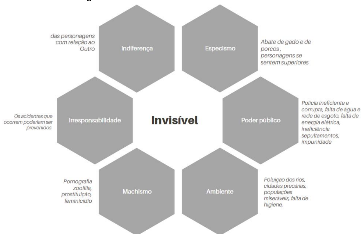
Figura 2 – Violências invisíveis em obras de Ana Paula Maia