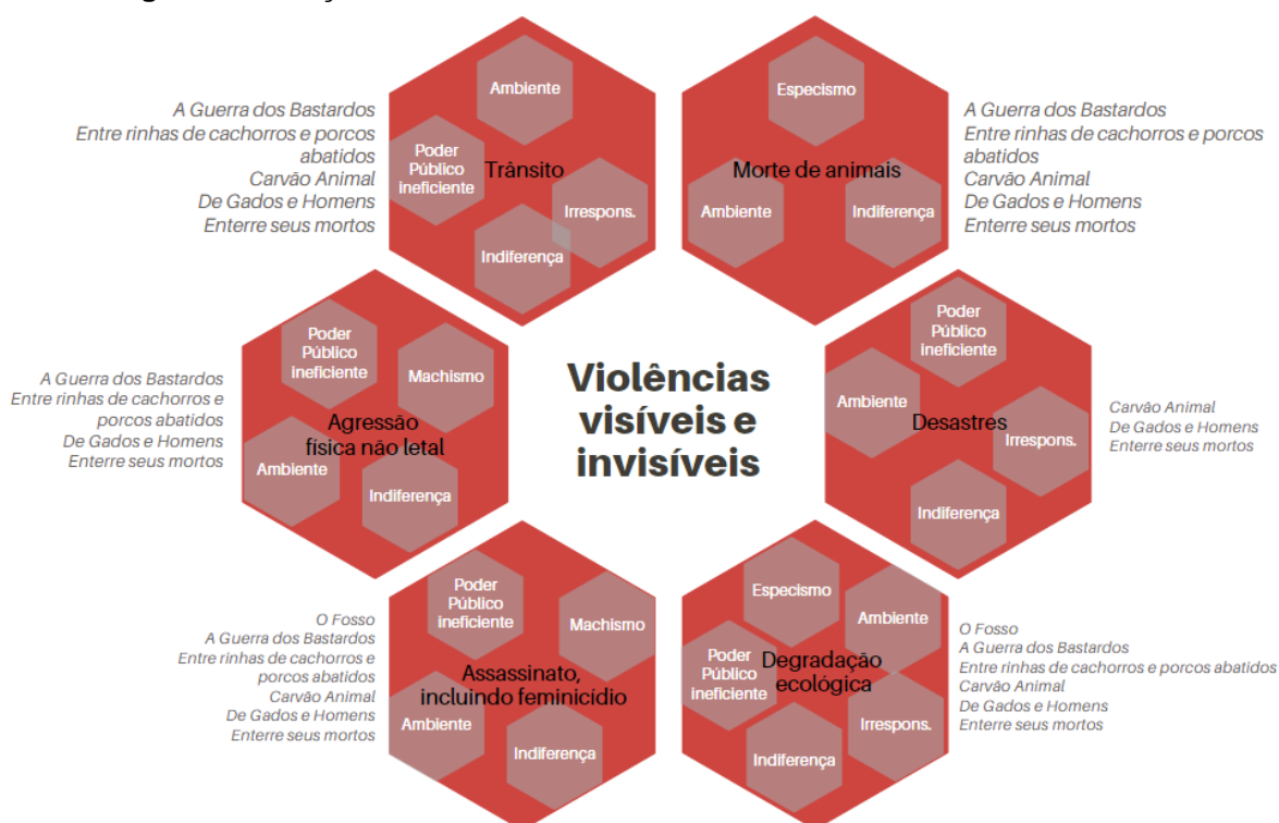
Figura 3 – Relação entre violências visíveis e invisíveis em obras de Ana Paula Maia

A seguir, na Figura 3, as violências invisíveis aparecem sobrepostas aos hexágonos das violências visíveis , com o intuito de representar graficamente de que modo as primeiras se relacionam com as segundas.