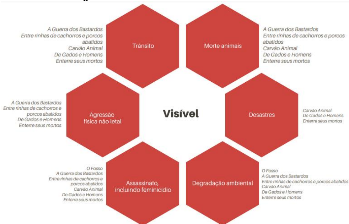
Figura 1 – Violências visíveis em obras de Ana Paula Maia